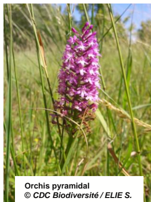
Orchis pyramidal