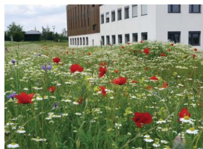
Prairie et gestion différenciée